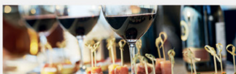
OBIEKTY GASTRONOMICZNE, HOTELE