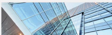
OBIEKTY HANDLOWE I USŁUGOWE