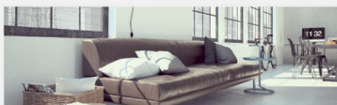
POKOJE I DOMY MIESZKALNE